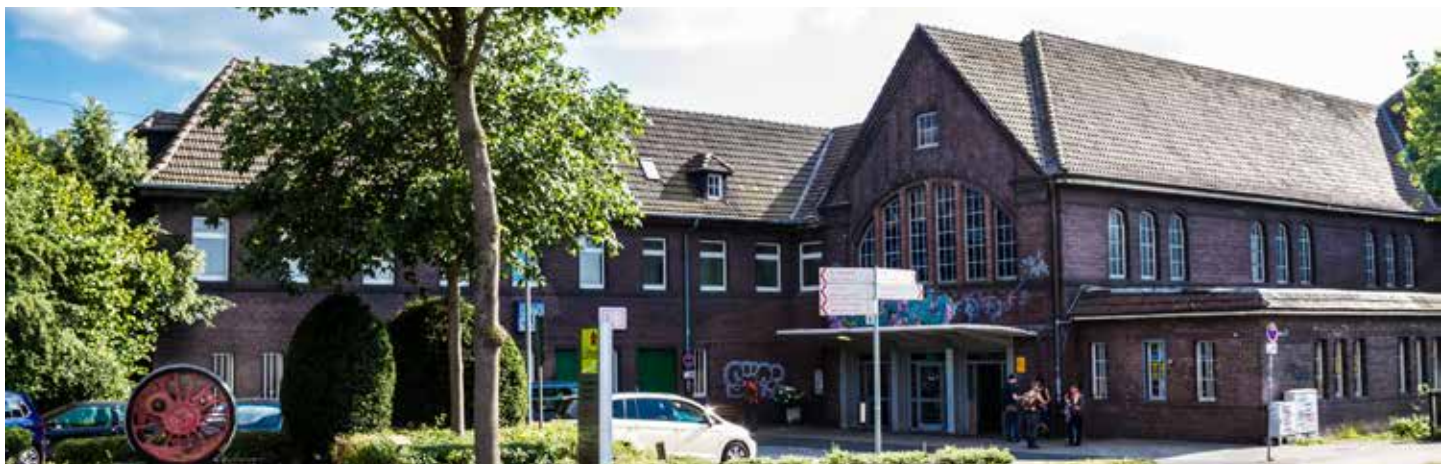
Der Bahnhof wird endlich wieder mit Leben gefüllt. Die Gleisanlagen sind schon modernisiert!