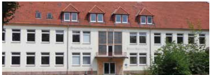
Von einer leeren Schule zum Mehrgenerationenhaus – ein Vorzeigeprojekt entsteht!