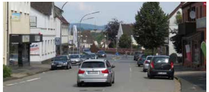
Eine Nord-Süd-Verkehrsader ist in die Jahre gekommen und muss den heutigen Bedarfen angepasst werden.

Große Hoffnung und hohe Aufmerksamkeit setzt der Ortsverein auf die Entwicklung und Erstellung eines Mehrgenerationenhauses in der Alten Grundschule Löhne-Bahnhof. Hier besteht die Chance, im Kern dieses Stadtteiles nachhaltig eine modellhafte Einrichtung zu entwickeln.