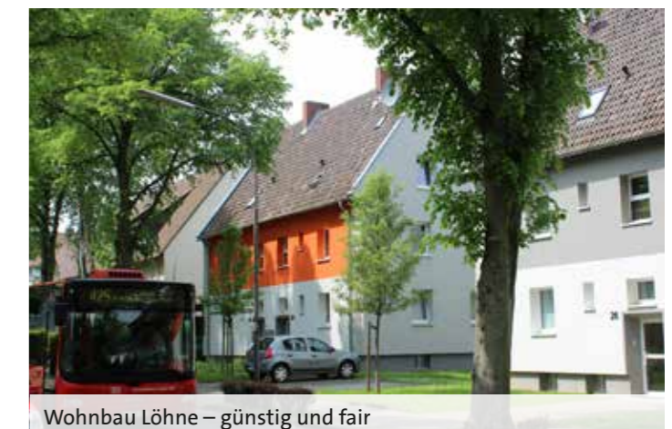
Wohnbau Löhne – günstig und fair

In Löhne ist der Wohnungsmarkt zwar nicht so angespannt wie in den Ballungsgebieten, doch Wohnungen für Singles und Familien mit geringen Einkommen sind auch in Löhne knapp. Um gerade die jungen Menschen nicht aus diesem Grund zu verlieren und sie am Arbeitsmarkt in Löhne zu halten, möchte die SPD einen städtischen Wohnungsmarkt mit erschwinglichen Preisen und ansprechender Ausstattungsqualität schaffen. Die neugegründete „Wohnstadt Löhne“ als Teil der neuen Stadtwerke, für die sich die Sozialdemokratie viele Jahre eingesetzt hat, soll hier neuen bezahlbaren Wohnraum schaffen und die weit über 400 Mietwohnungen im Eigentum der Stadt weiter ausbauen und für die Bürger erhalten. Dass die SPD vor Jahren den konservativen Forderungen widerstanden und den Großteil der städtischen Wohnungen eben nicht privatisiert hat, erweist sich jetzt als ausgesprochen günstig für viele wohnungssuchende Haushalte. Ein Beispiel sind die Mehrfamilienhäuser in der Jahnstraße. Hier gibt es sanierte städtischen Wohnungen und gleich daneben sanierungsbedürftige Wohnblöcke privater Gesellschaften mit ungewissem Zeitplan einer Modernisierung. Dagegen geht es bei den städtischen Wohnungen planmäßig weiter, z. B. in der Goethestraße. Der Erhalt und die Erweiterung des sozialen Wohnungsbaus ist eine der Kernforderungen der Löhner SPD, die sich damit am Gemeinwohl orientiert.