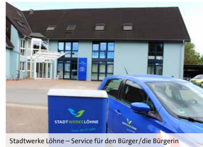
Stadtwerke Löhne – Service für den Bürger/die Bürgerin