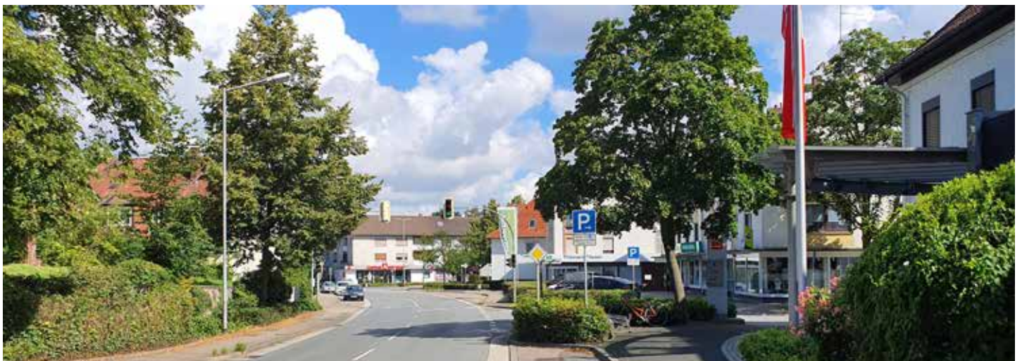
Das Kandidatenteam der SPD Gohfeld fordert ein modernes Planungskonzept für ein attraktives Ortszentrum in Gohfeld.

Weitere politische Schwerpunkte finden sich in den Kandidaten-flyern der SPD, die den Bürgern noch zugehen.