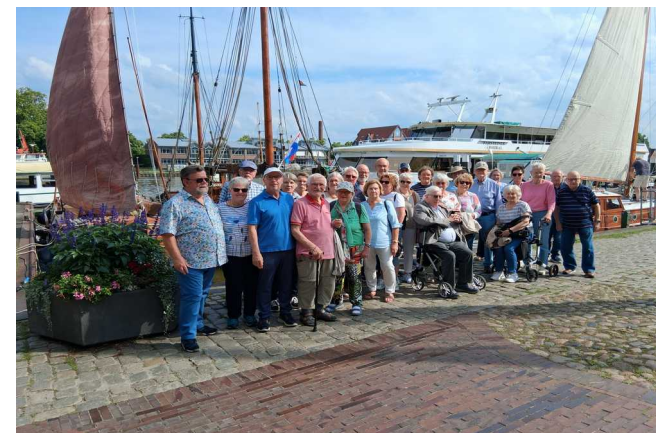
Foto: AG 60plus im Juli 2025, Tagesfahrt mit Flußkreuzfahrt

Politisch, kulturell aktiv und immer in Fahrt.